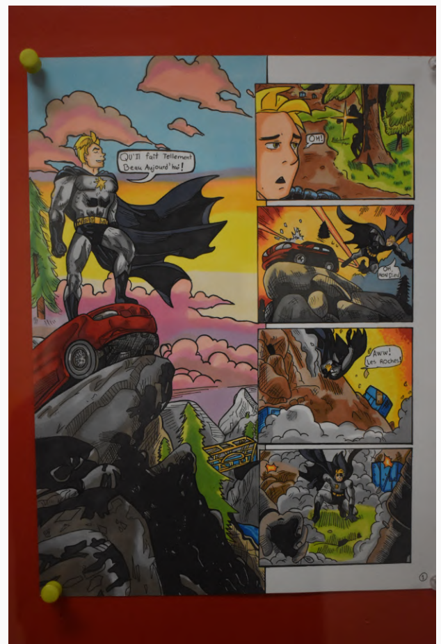
(C) Faris Hassan El Jami Source : Sabrina Grace Dimi, club photo