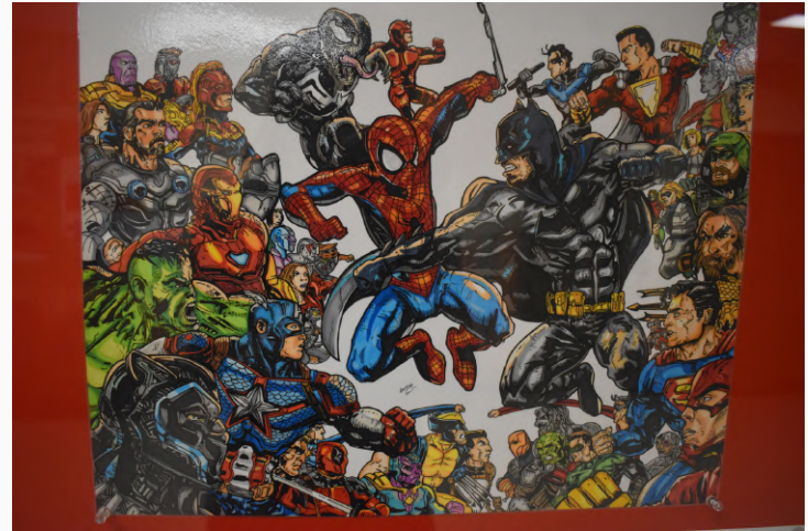
(C) Faris Hassan El Jami Source : Sabrina Grace Dimi, club photo